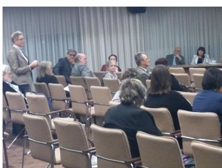
SPOTKANIE ŚRODOWISKOWE 2014