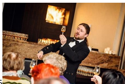
2015 DEGUSTACJA WHISKY 2015