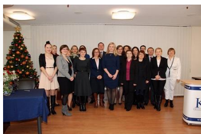
ŚLUBOWANIE 4. XII. 2013