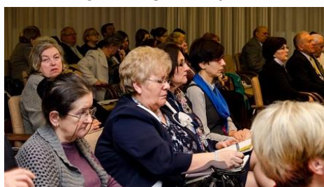
SPOTKANIE ŚRODOWISKOWE 2014