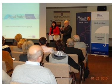
SZKOLENIE Z DORADCAMI PODATKOWYMI